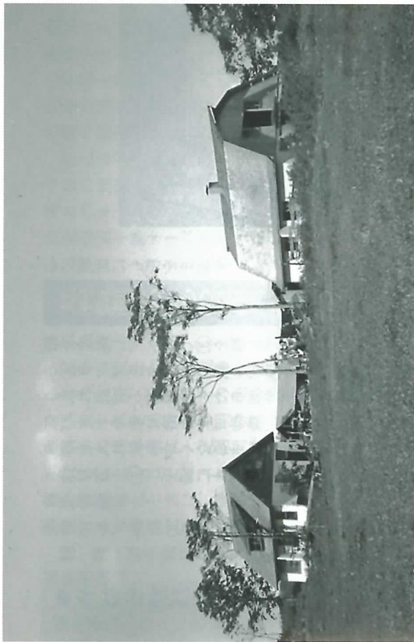
パイロットファームの牛舎と住宅（パイロットファーム開拓資料館の展示より）