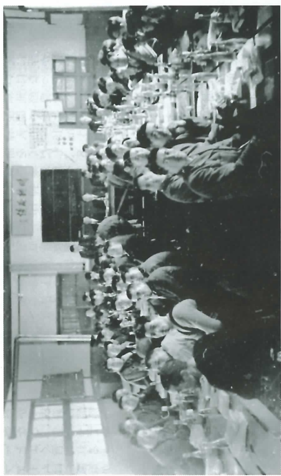
パイロットファーム開拓農協設立総会 (会場は弟子屈の釧路拓殖実習場の講堂。 閉会後の懇親会だろうか。正面、黒板の上は「開拓のモットー」だった)。

入と、協力の力に依り不足分を補 い、労働力の調整をなし、より効 率的に事業の進捗を図らなければ ならないと考え……床丹開拓農業